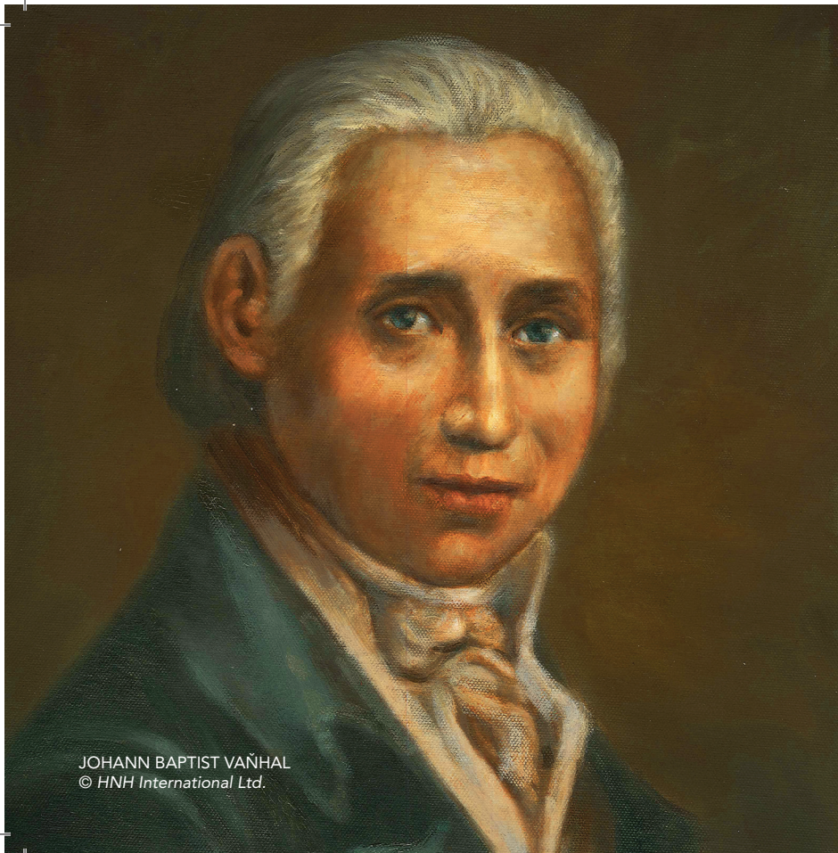
JOHANN BAPTIST VAÑHAL