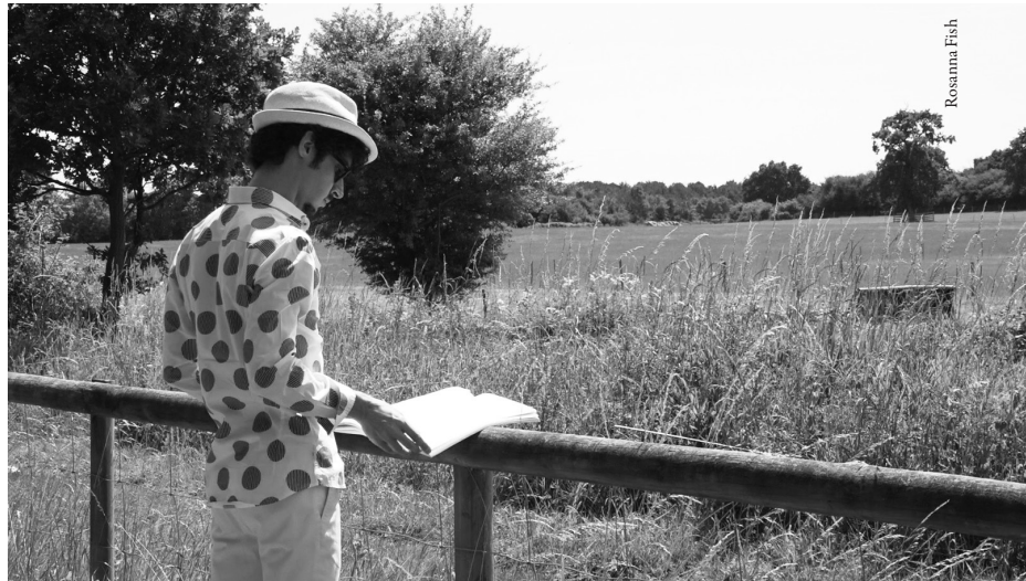
Federico Colli at Potton Hall during the recording sessions

Sociedad Filarmónica de Bilbao, Società dei Concerti di Milano, White Nights Festival in St Petersburg, Joy of Music Festival in Hong Kong, Dvořák Prague International Music Festival, Cidade das Artes in Rio de Janeiro, Musashino Civic Cultural Hall in Tokyo, and Tokyo Bunka Kaikan.