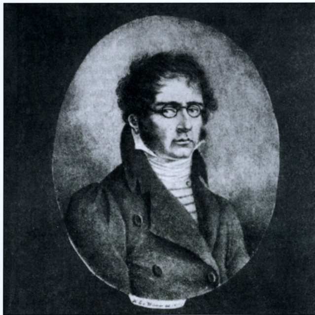
Franz Danzi (nach dem Stich von Heinrich E. von Winter, 1817)