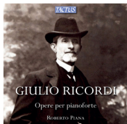
TC 841801 GIULIO RICORDI Opere per pianoforte Piano Works Roberto Piana