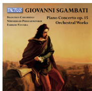
TC 841908 GIOVANNI SGAMBATI Concerto per pianoforte op. 15 - opere orchestrali Piano Concerto op. 15 - Orchestral Works Francesco Caramiello - Nürnberger Philharmoniker