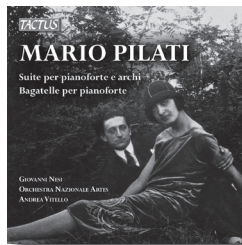
TC 901602 MARIO PILATI Opere per pianoforte e pianoforte e archi Giovanni Nesi · Orchestra Artes · Andrea Vitello