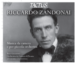
TC 882480 (3Cd) RICCARDO ZANDONAI Musica da Camera e per piccola orchestra Trio Guarino · Orchestra da Camera di Trento