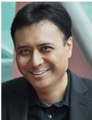
JON NAKAMATSU piano

American pianist JON NAKAMATSU elicits unanimous praise as a true aristocrat of the keyboard, whose playing combines deep musical insight with elegance, clarity and electrifying power.