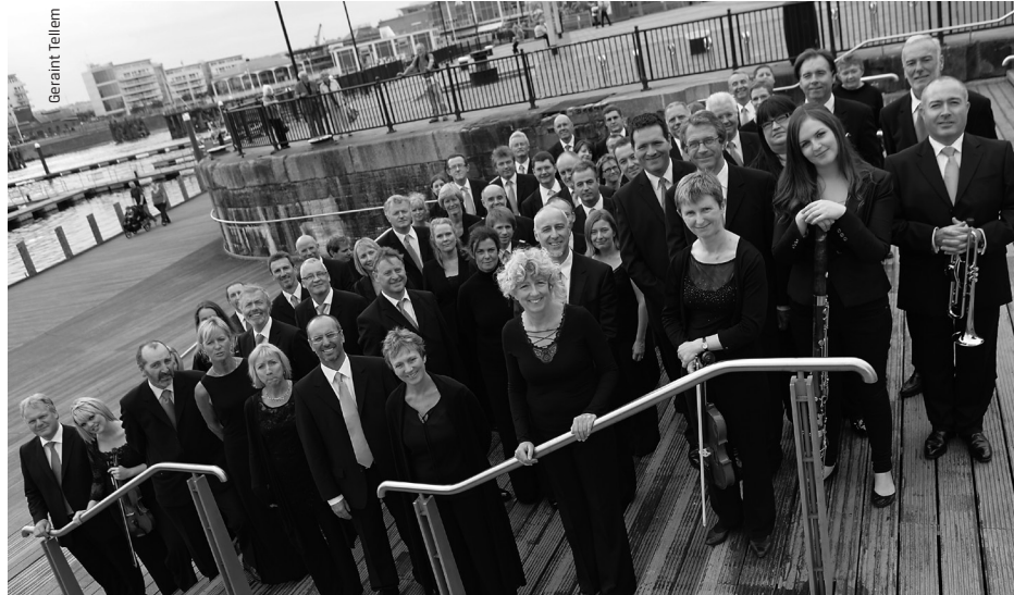
BBC National Orchestra of Wales

de nombreux enregistrements, notamment plusieurs CD primés et des CD nommés aux Grammy Awards dans la série Musiques de film de Chandos qui connaît un grand succès.