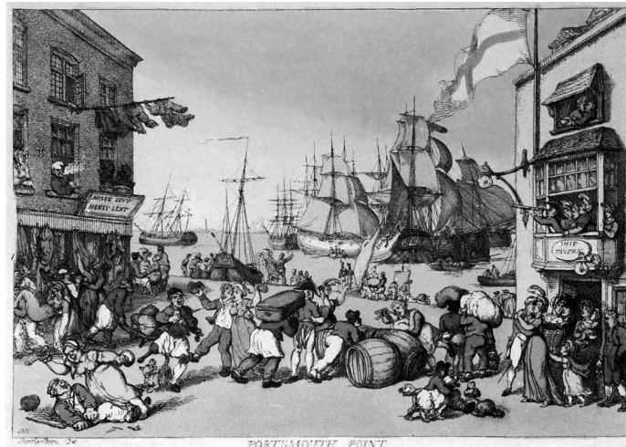
'Portsmouth Point', etching (c. 1811) by Thomas Rowlandson (1756 - 1827)