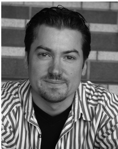
DUNCAN GIFFORD, piano

El pianista australiano Duncan Gifford ha demostrado ser uno de los pianistas con más talento de su generación, obteniendo su mayor éxito internacional en 1998 con el Primer Gran Premio en el prestigioso Concurso Internacional "José Iturbi" en España, y en 2000 con el "Gran Prix Maria Callas" en Atenas.