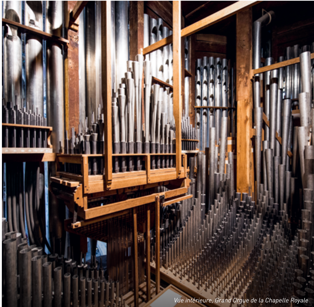
Vue intérieure, Grand Orgue de la Chapelle Royale