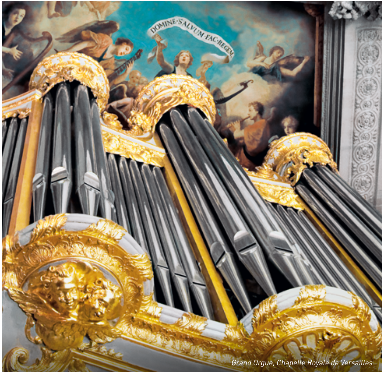
Grand Orgue, Chapelle Royale de Versailles