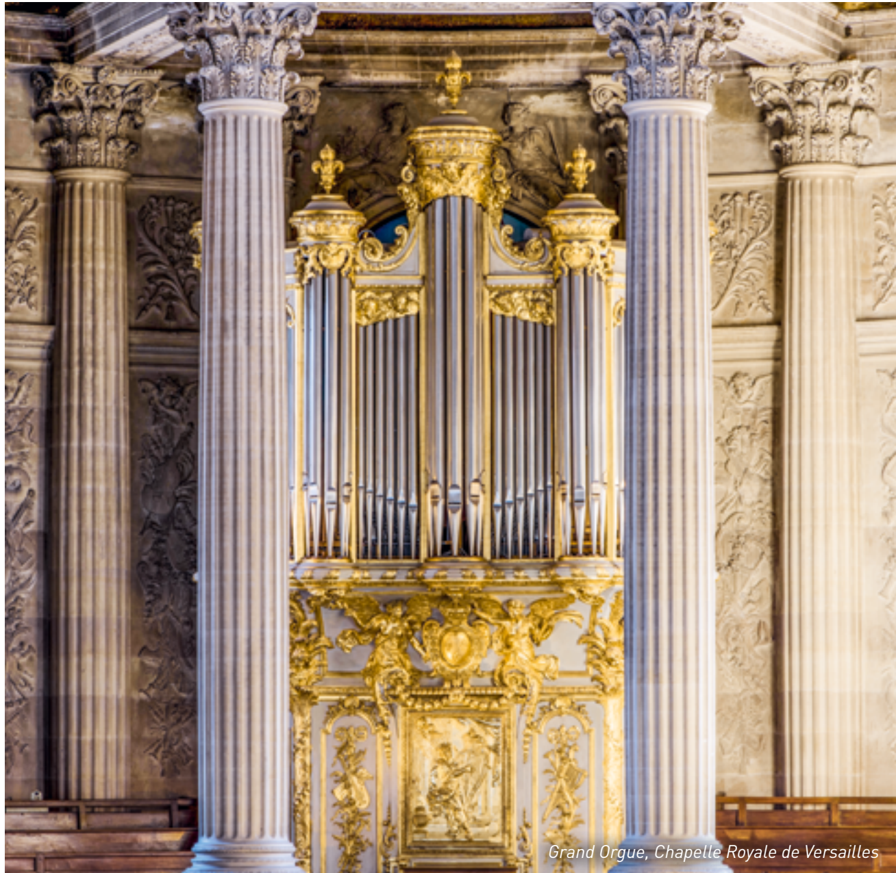
Grand Orgue, Chapelle Royale de Versailles