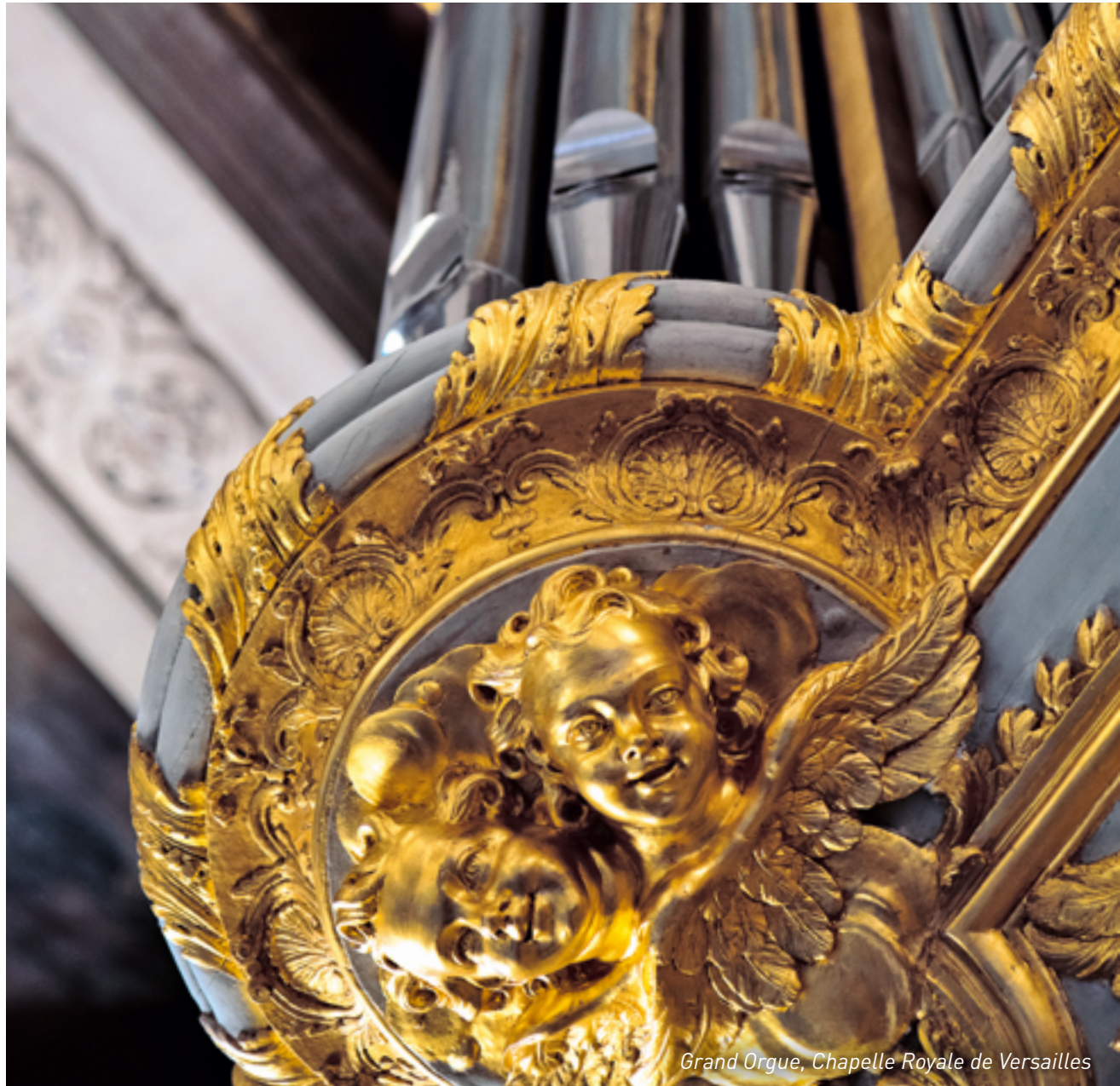
Grand Orgue, Chapelle Royale de Versailles