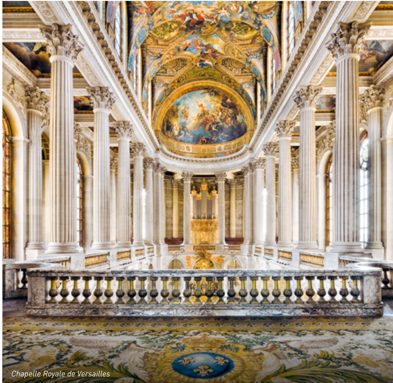
Chapelle Royale de Versailles