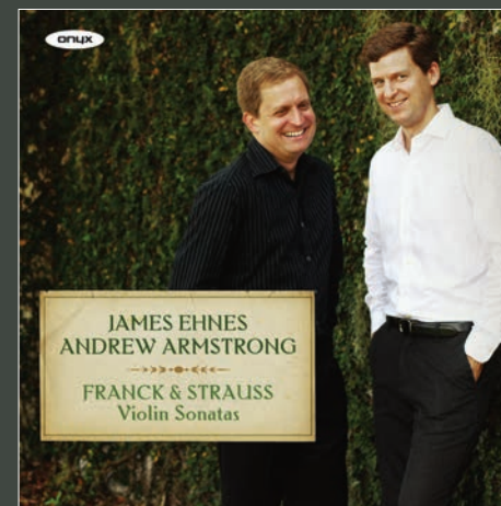
ONYX 4141 Franck & Strauss: Violin Sonatas James Ehnes, Andrew Armstrong