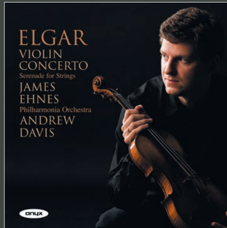
ONYX 4025 Elgar: Violin Concerto James Ehnes Philharmonia, Sir Andrew Davis