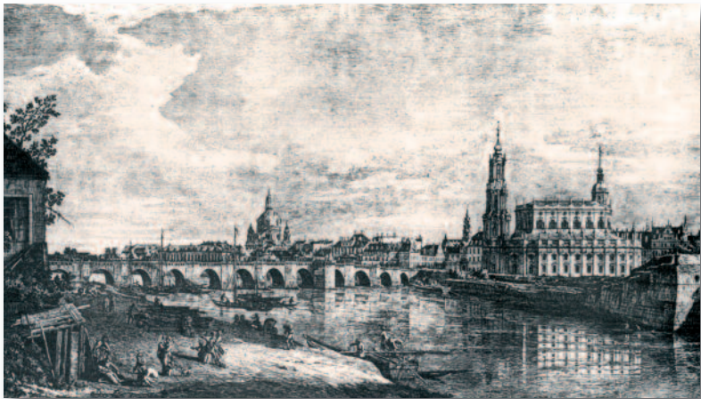
DRESDEN: VIEW OF THE CASTLE AND THE ELBE BRIDGE (WITH THE HOFKIRCHE TO THE RIGHT) Etching by Bernardo Bellotto, 1748