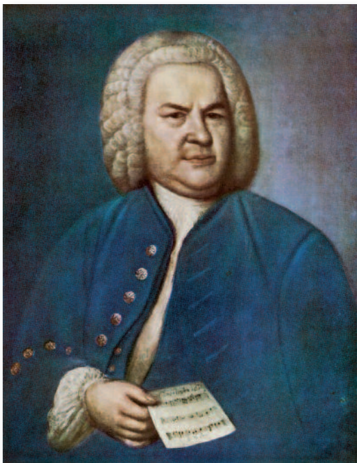
JOHANN SEBASTIAN BACH Portrait by Elias Gottlob Haußmann, 1746