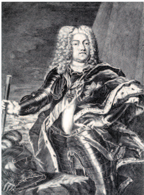
FRIEDRICH AUGUST II, ELECTOR OF SAXONY AND, AS AUGUST III, KING OF POLAND (1696–1763)