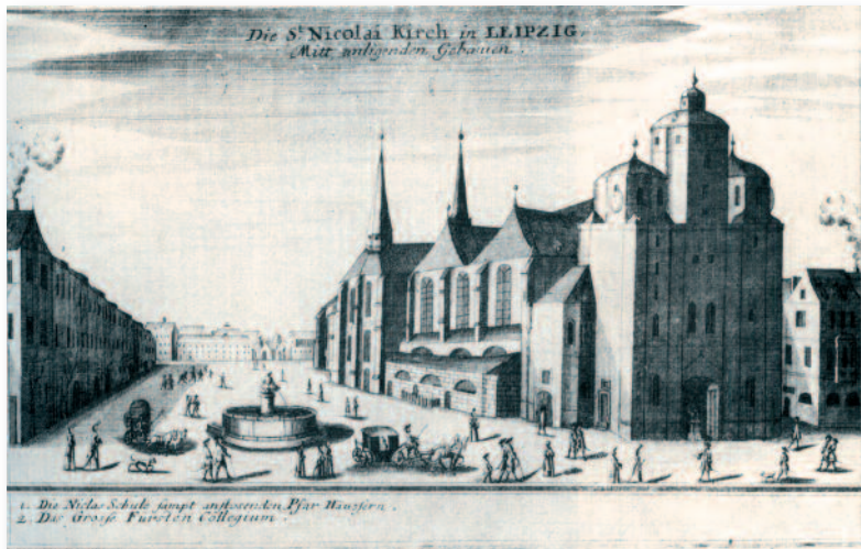
THE NIKOLAIKIRCHE IN LEIPZIG Engraving published by Gabriel Bodenehr the elder, Augsburg