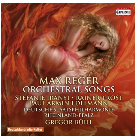
MAX Reger Orchestral Songs C5275