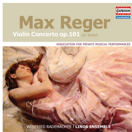
MAX Reger Violin Concerto (Chamber Music Version) C5137