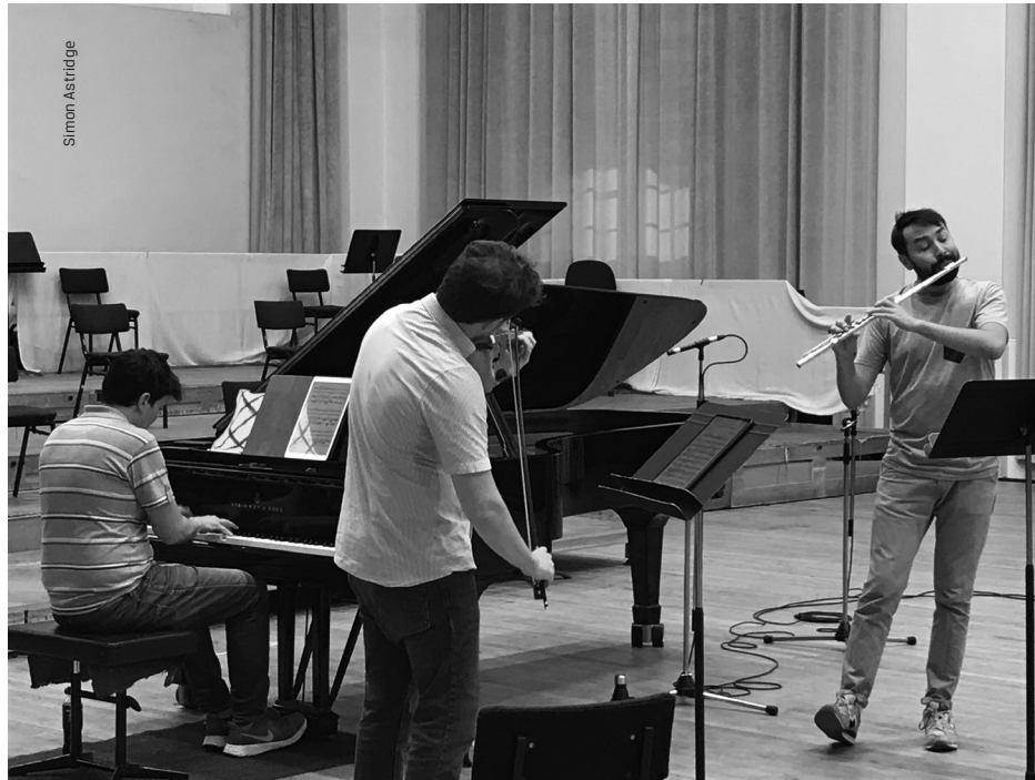
The musicians during the recording sessions