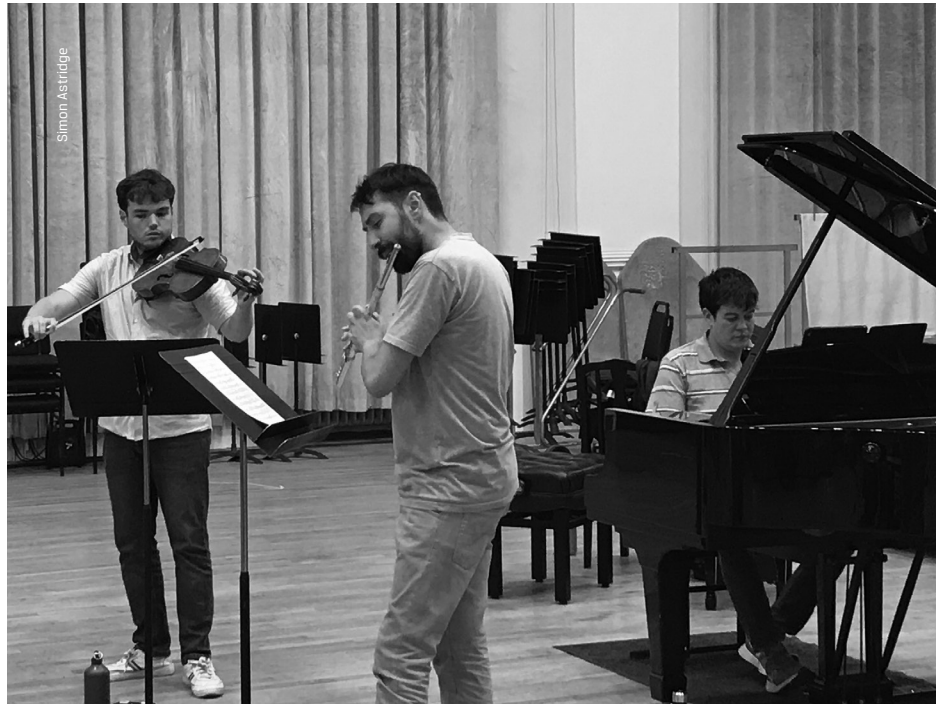
The musicians during the recording sessions