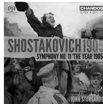
Shostakovich Symphony No. 11 'The Year 1905' CHSA 5278