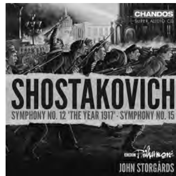
Shostakovich Symphony No. 12 'The Year 1917' Symphony No. 15 CHSA 5334