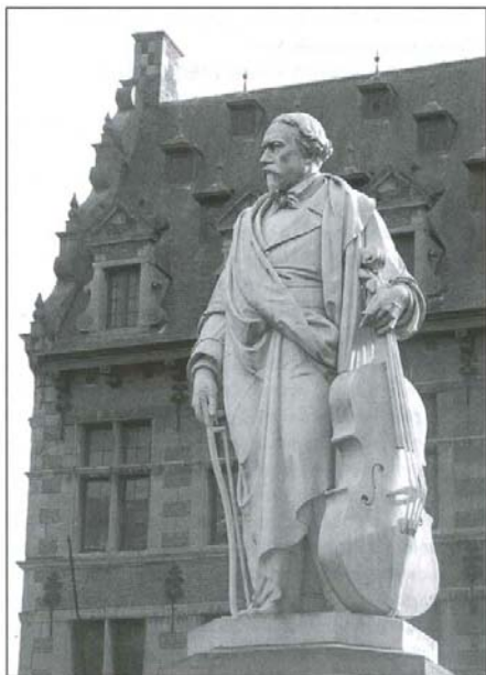
Statue of François Servais by Cyprien Godebski in Halle, 1869, photo 2003

In 2011, he will be recording and touring with the Muenchner Rundfunk Orchestra and the Czech National Symphony Orchestra.