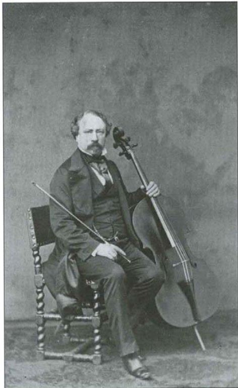
François Servais by Ghémar, ca. 1862 © Servais Collection, Halle (Belgium)