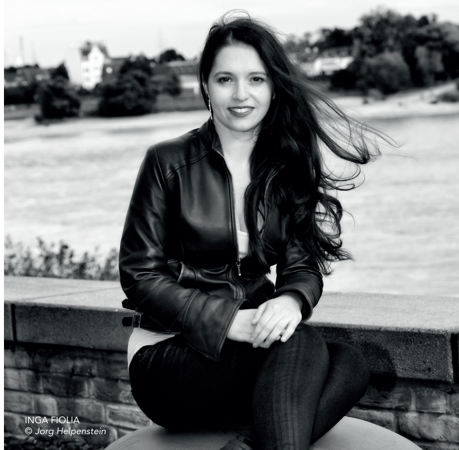
INGA FOLIA