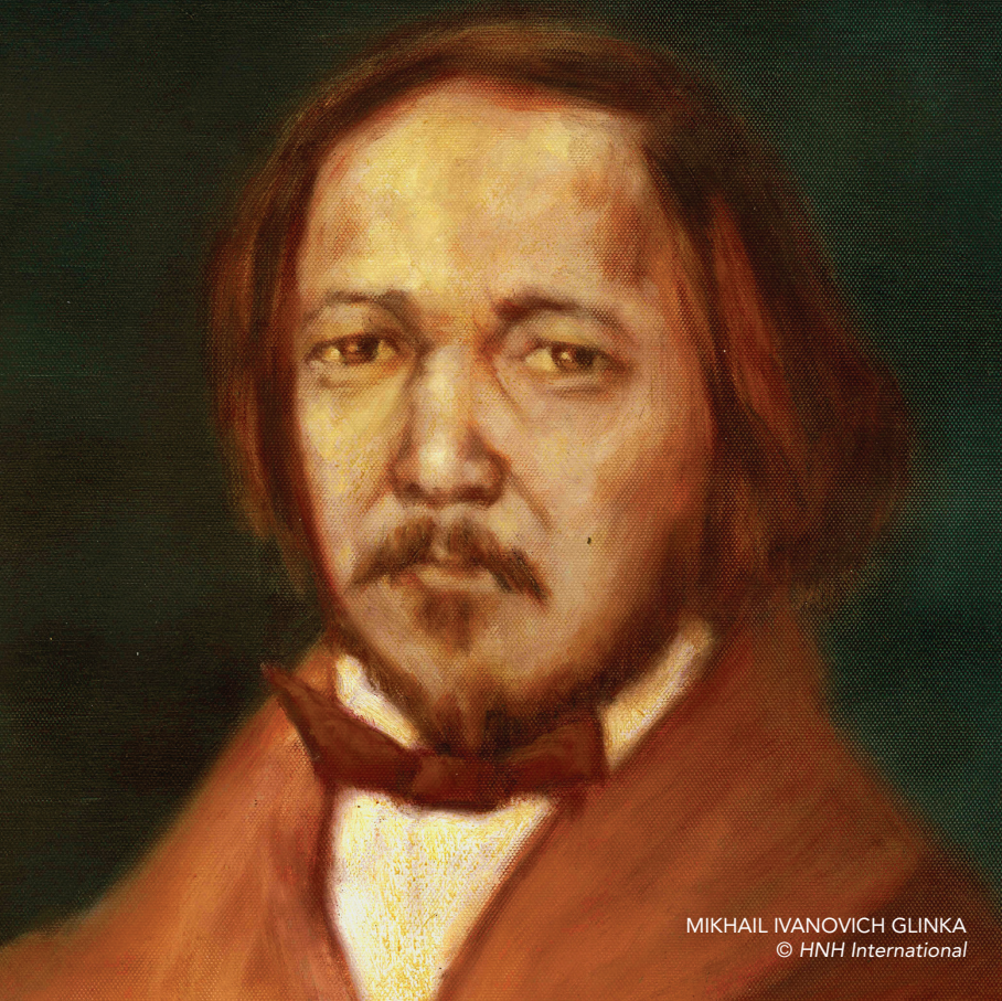
MIKHAIL IVANOVICH GLINKA