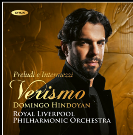
Verismo Preludi e Intermezzi ONYX4242