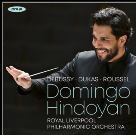
Debussy · Dukas · Roussel ONYX4224