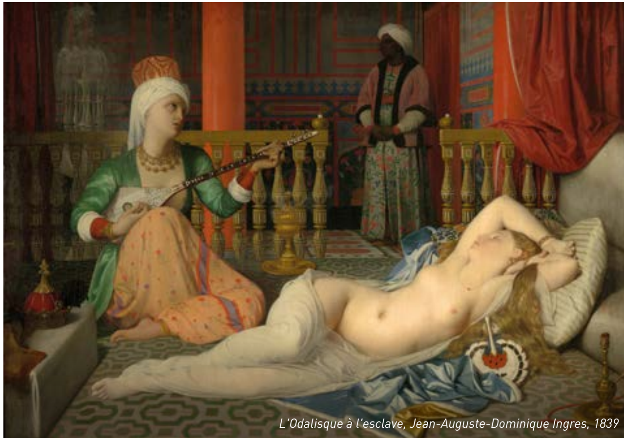
L'Odalisque à l'esclave, Jean-Auguste-Dominique Ingres, 1839