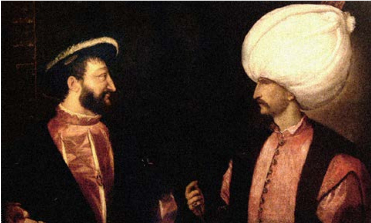
François Ier & Soliman le Magnifique, Titian, vers 1530