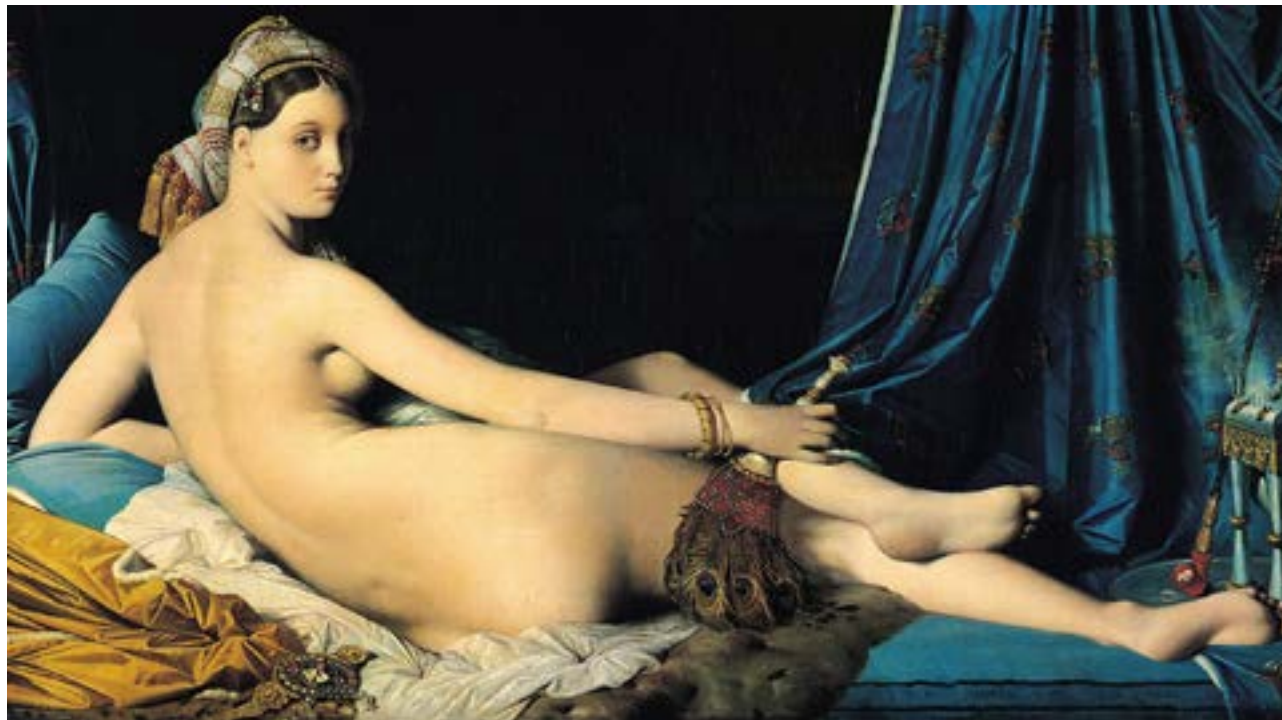
La Grande Odalisque, Jean-Auguste-Dominique Ingres, 1814