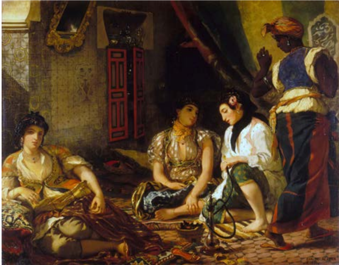
Les femmes d'Alger dans leur appartement, Eugène Delacroix, 1834