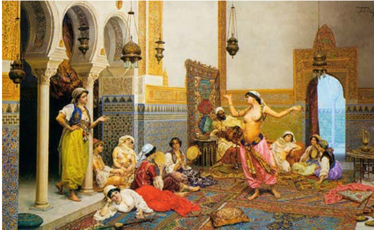
La Danse du Harem, Giulio Rosati