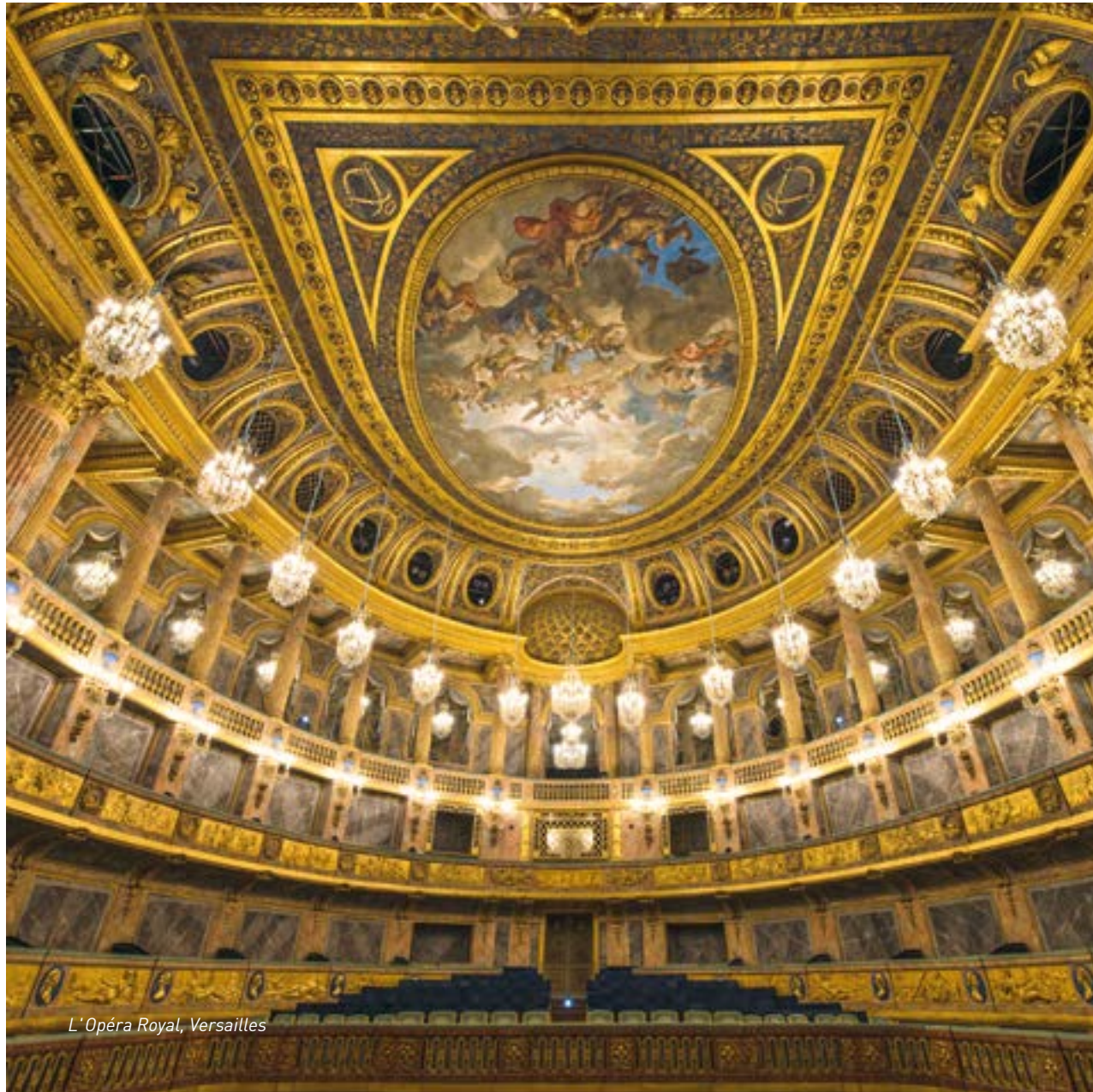
L'Opéra Royal, Versailles