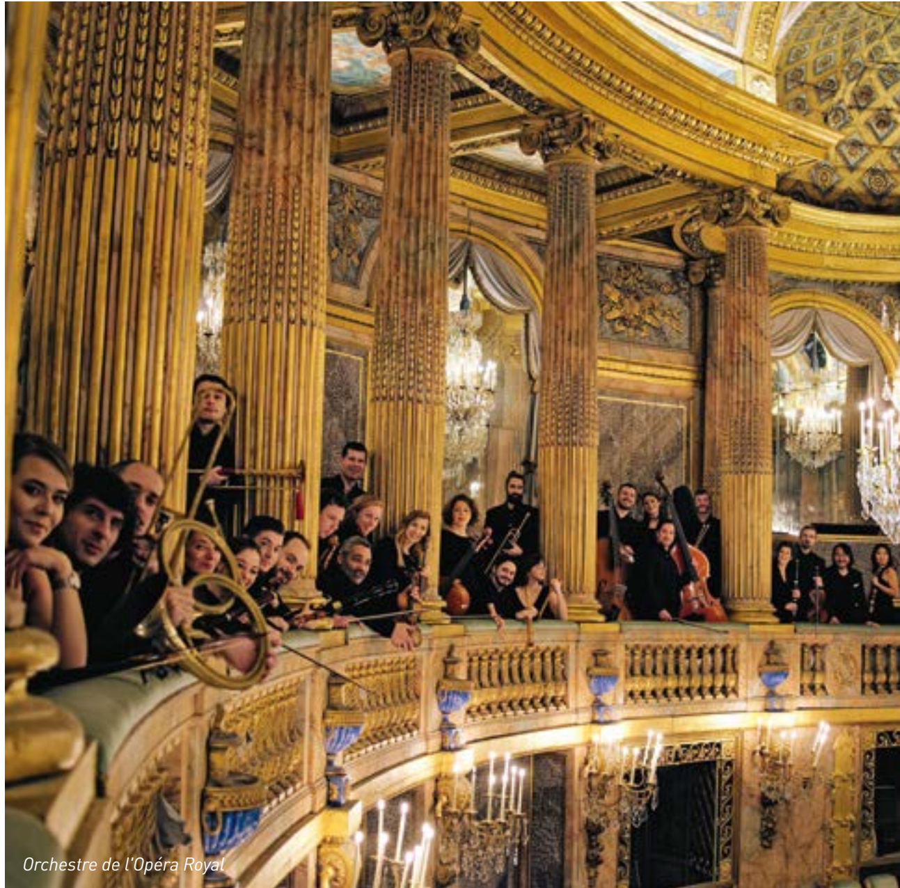
Orchestre de l'Opéra Royal