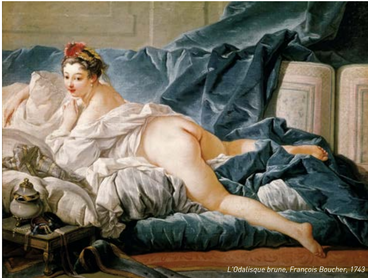
L'Odalisque brune, François Boucher, 1743