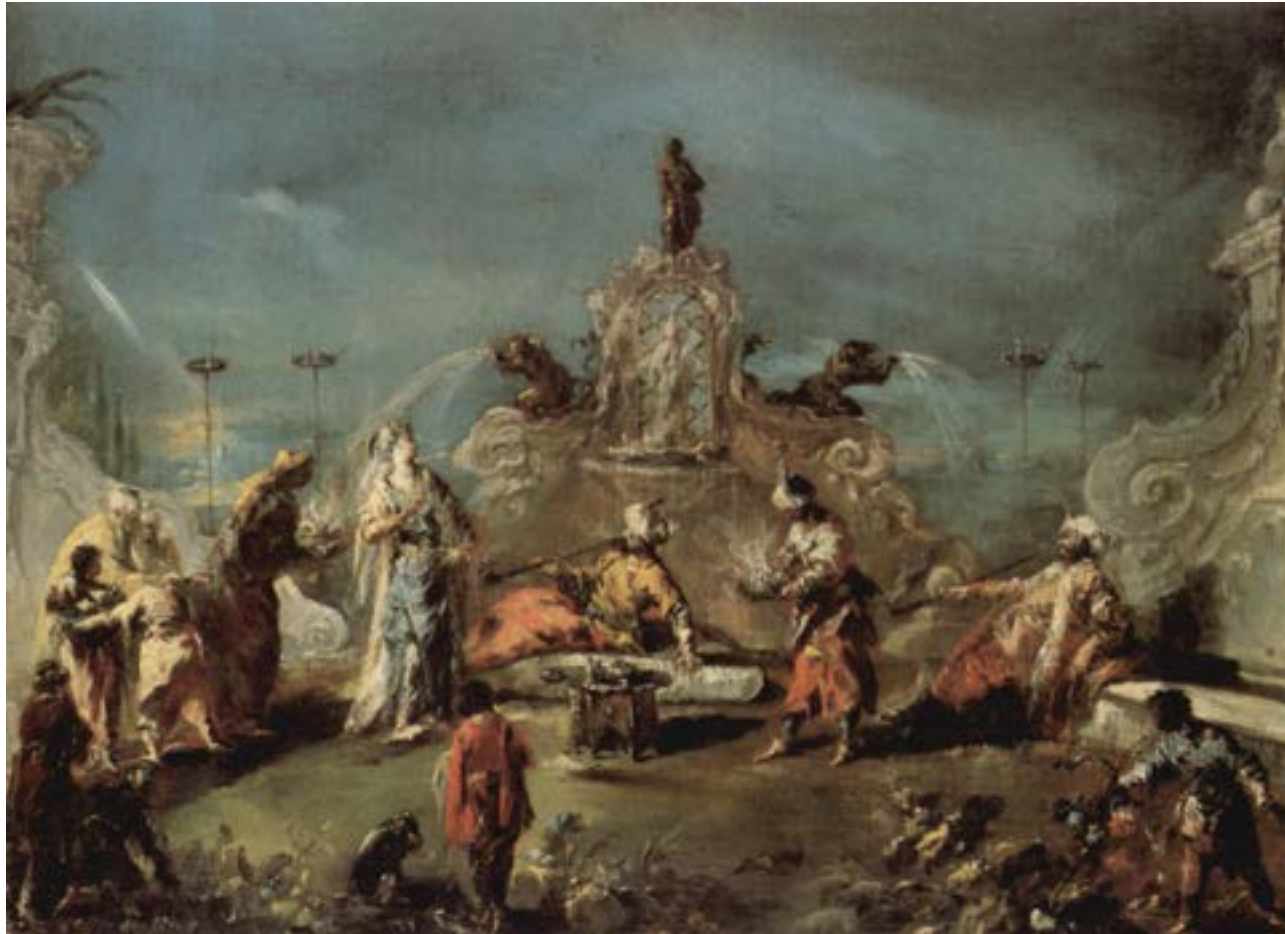
Scène de jardin et sérails, Gianantonio Guardi, 1742