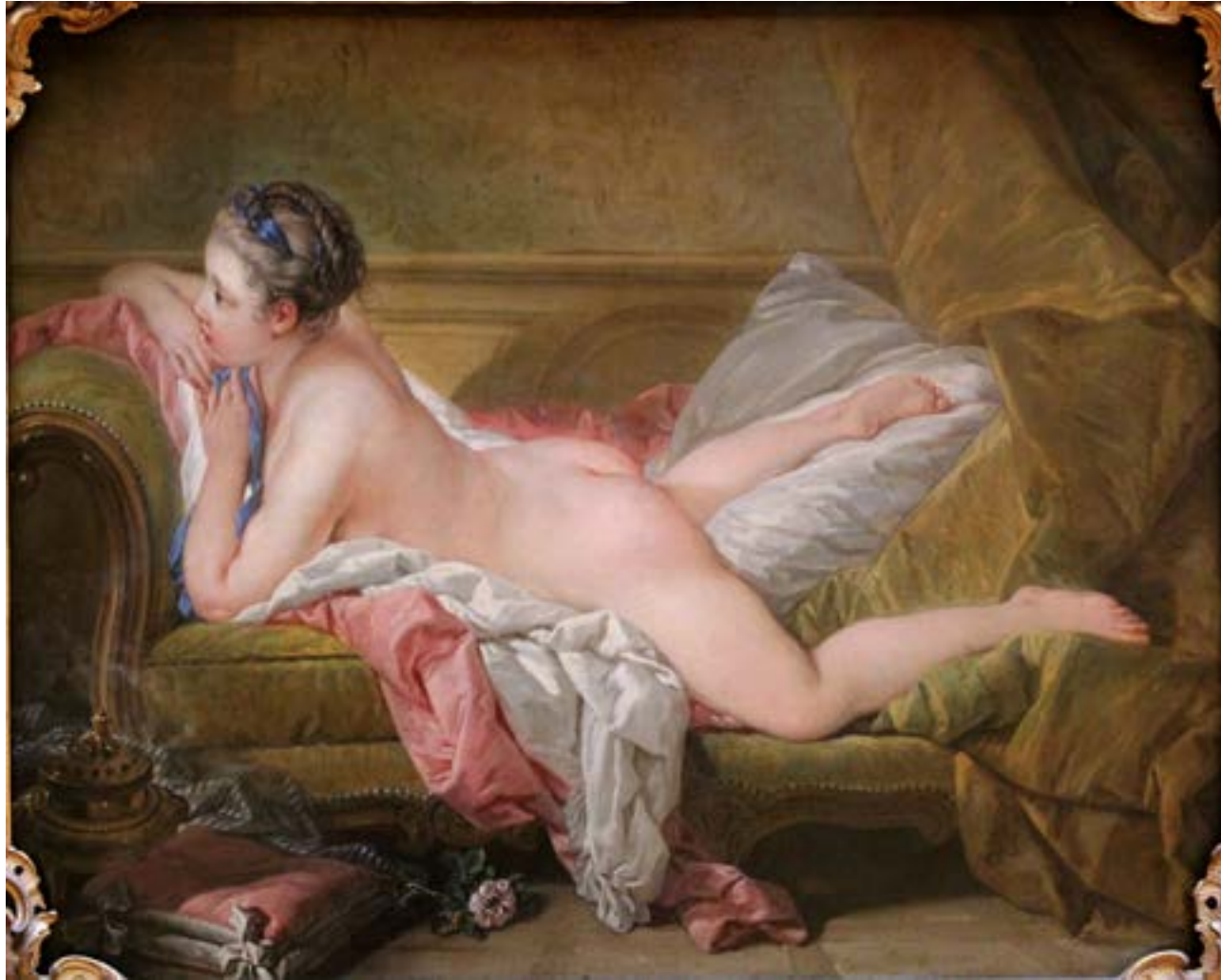
L'Odalisque blonde, François Boucher, 1752