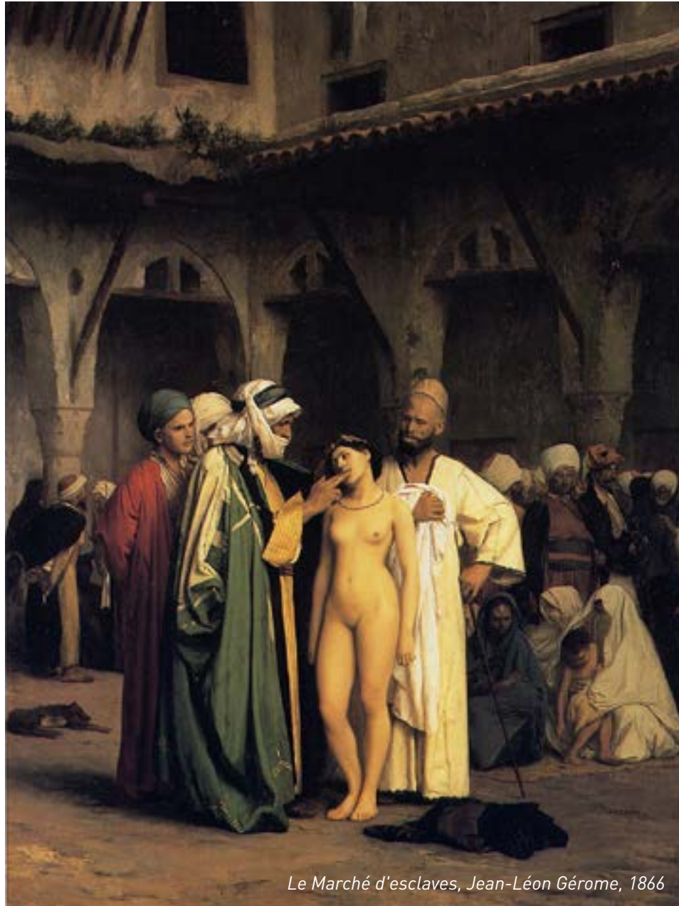
Le Marché d'esclaves, Jean-Léon Gérôme, 1866