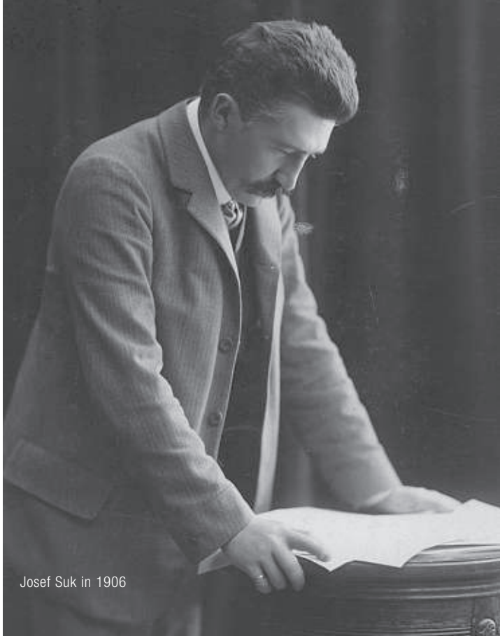
Josef Suk in 1906