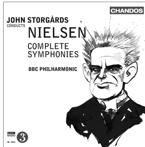
Nielsen Complete Symphonies CHAN 10859(3)