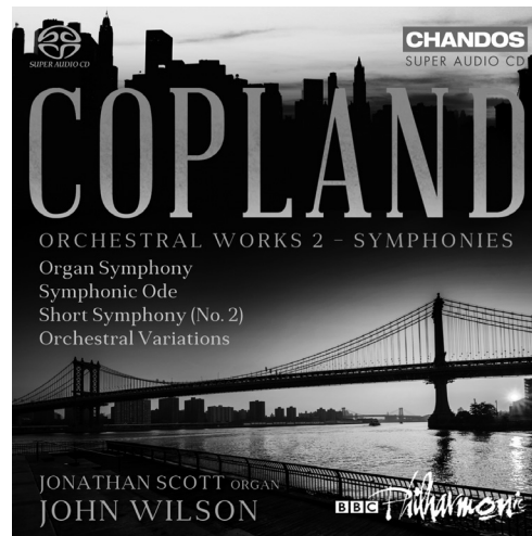
Copland Orchestral Works, Volume 2 CHSA 5171