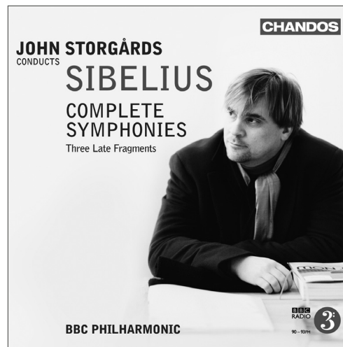
Sibelius Complete Symphonies • Three Late Fragments CHAN 10809(3)