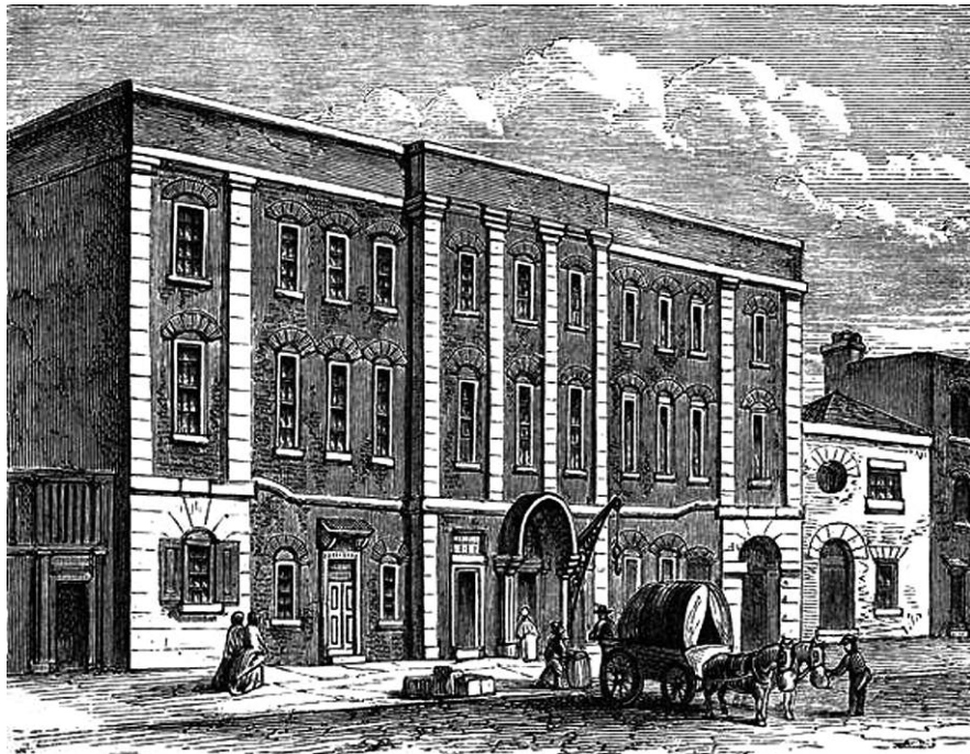
Lincoln's Inn Fields Theatre in 1821, from an original sketch by Frederick William Fairholt