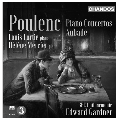
Poulenc Piano Concertos, Aubade, and other works CHAN 10875