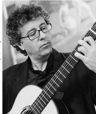
Tampere Guitar Festival