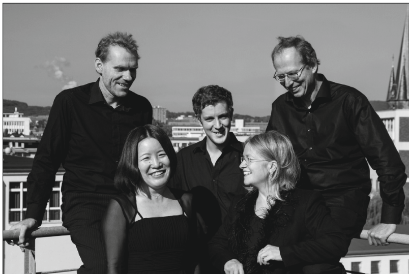
Via Nova Quartett