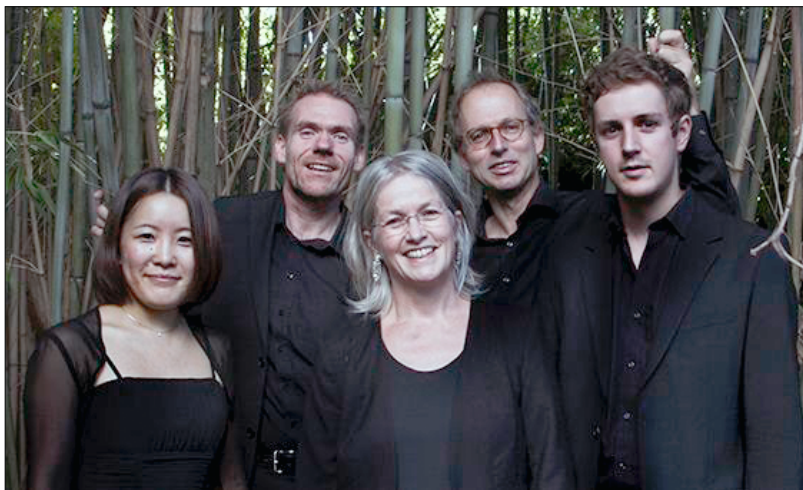
Via Nova Quartett