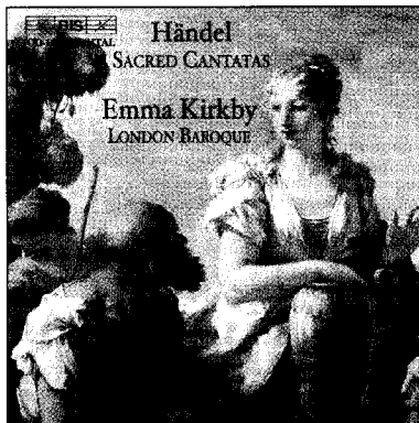
Georg Friederich Händel Sacred Cantatas Emma Kirkby, soprano BIS-CD-1065

Other recordings by London Baroque on BIS include: