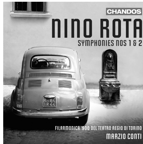
Rota Symphonies Nos 1 and 2 CHAN 10546