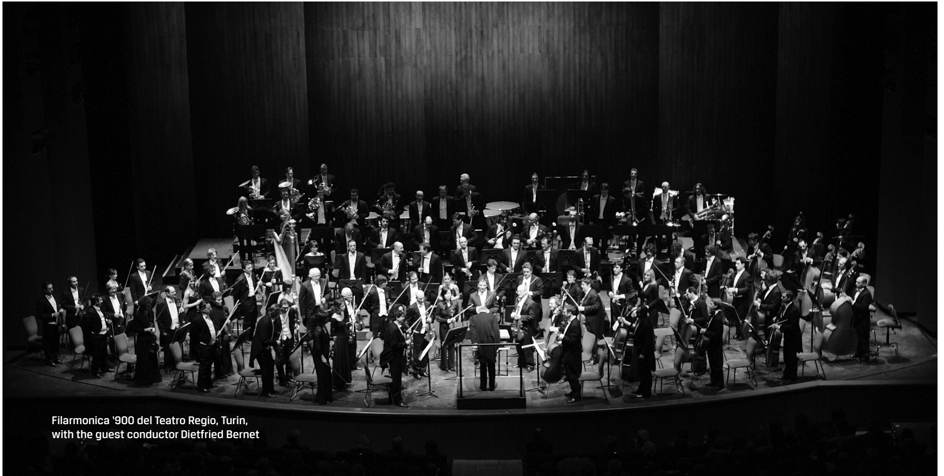
Filarmonica '900 del Teatro Regio, Turin, with the guest conductor Dietfried Bernet