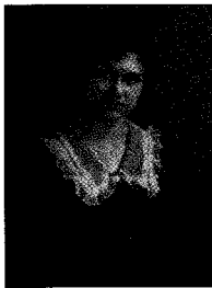
Ruth Crawford, 1918