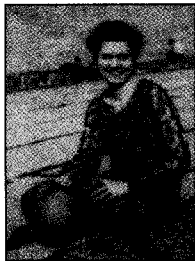
Ruth Crawford, Chicago ca. 1925