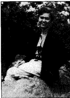
Ruth Crawford Seeger, ca. 1931

Tom's father was mending a shirt. Tom's mother was making supper. All of a sudden there was Tom on the back of a mouse! Father! I'm home! Father! Mother, here I am! Here I am, Mother! His mother took him in her arms and began to sing. Tom kissed her, jumped out of her lap and began to dance around impatiently. Listen, Father, listen, Mother, listen! And he began to tell them his story. I got lost. I wandered. And Mistress Tailor, Mistress Tailor... made terrible food and I told her so and she chased after me with her big feet. I hid under her thimble – but she found me – and threw me out of the window. I ran and ran into the big dark wood. There were wolves and owls, Mother, and robbers. In the big castle there were sentinels. And a king. A rich king. But I threw his dollars, lots and lots of them, out of the window. He still had plenty left... In the mouse's hole, the moon sang to me... She had a guitar. When the mouse came home, he wasn't very friendly. But we talked and we had bread and cheese – and he brought me home on his back. And here we are! He can stay here with us can't he, Father? ...Mother?