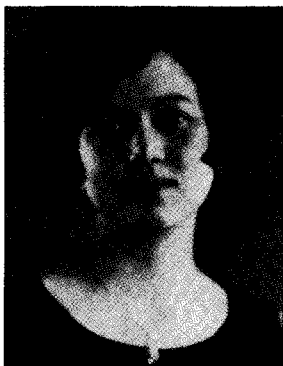
Ruth Crawford Seeger