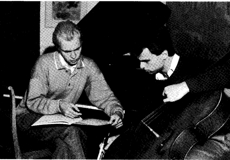
Roland Pöntinen and Torleif Thedéen