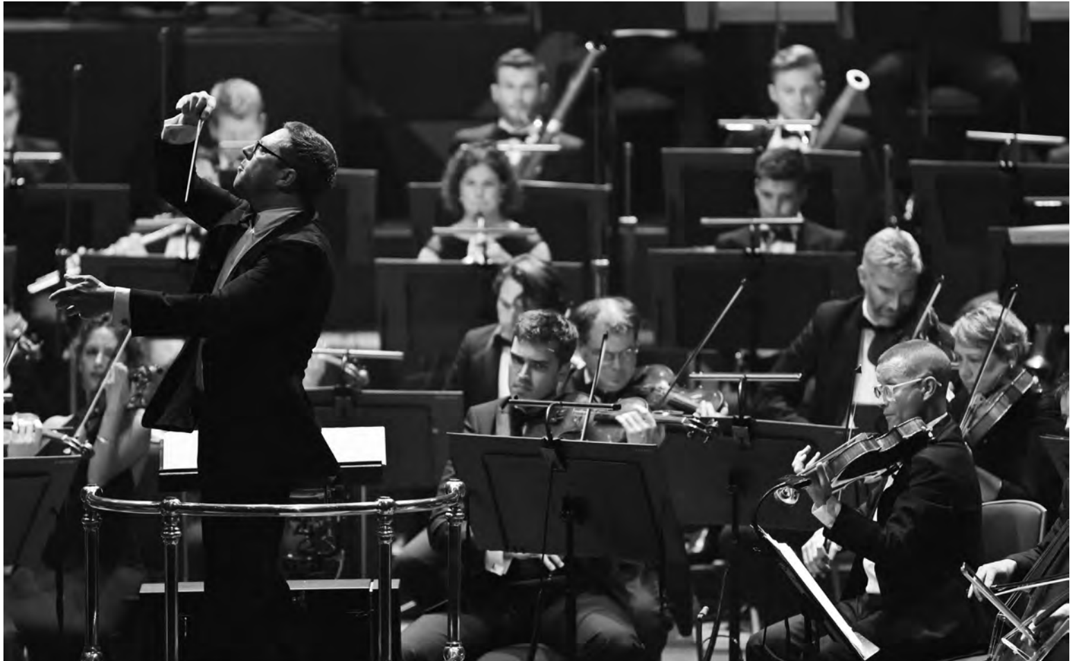
John Wilson and Sinfonia of London, at the BBC Proms, 4 September 2021