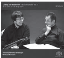
Ludwig van Beethoven Violinsonaten Vol. 2: Nr. 1-3, 8

Gramola 99050 SACD Michael Korstick piano/Klavier Thomas Albertus Irnberger violin/Violine