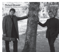
Richard Strauss, Violinsonate