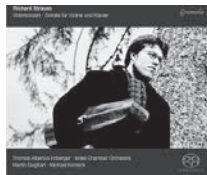
Richard Strauss, Violinkonzert, Violinsonate