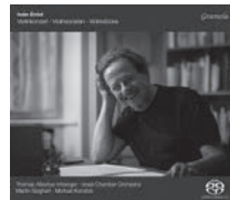
Iván Erőd, Violinkonzert, Violinsonaten, Violinstücke

Ludwig van Beethoven Violinsonaten Vol. 4: Nr. 6, 7, Rondo, Deutsche Tänze Gramola 99053 SACD Michael Korstick piano/Klavier Thomas Albertus Irnberger violin/Violine