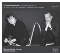
Ludwig van Beethoven Violinsonaten Vol. 3: Nr. 4, 5 „Frühling“, Variationen