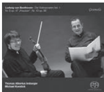
Ludwig van Beethoven Violinsonaten Vol. 1: Nr. 9 „Kreutzer“, 10