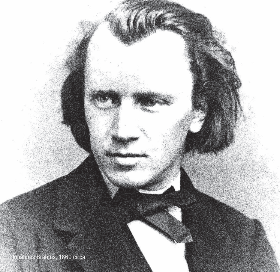
Johannes Brahms, 1860 circa