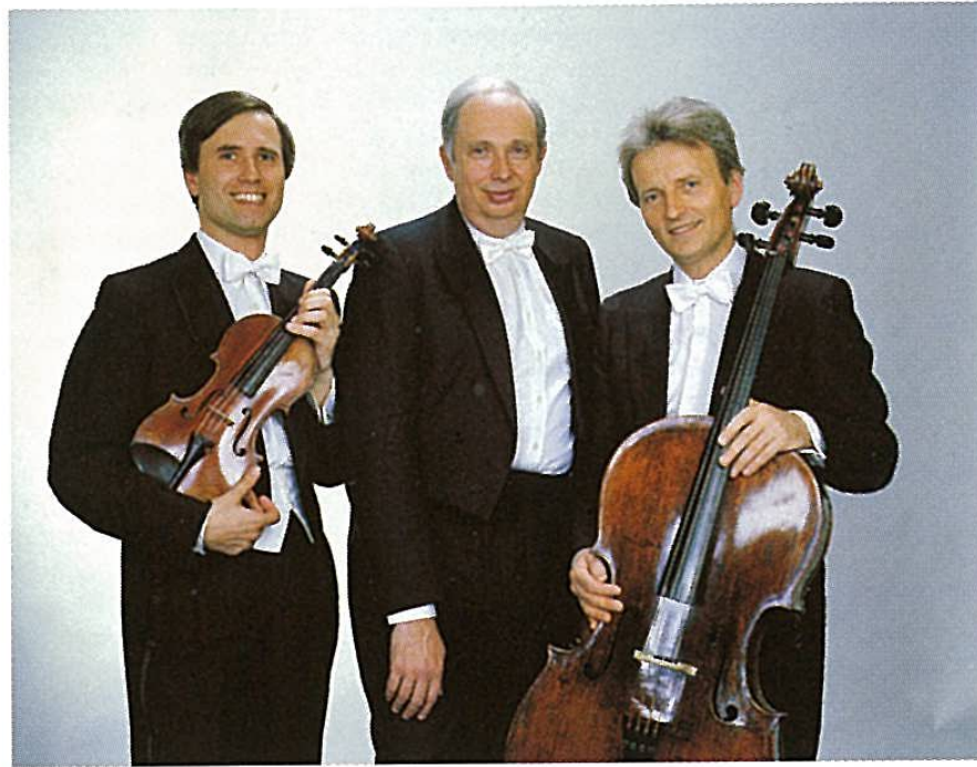
THE PRAGUE GUARNERI TRIO