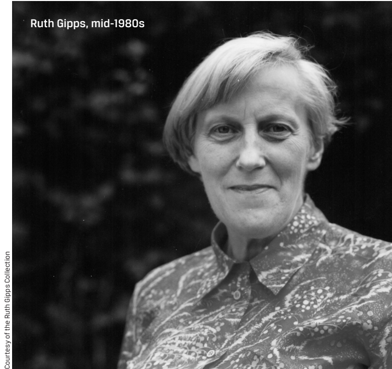
Ruth Gipps, mid-1980s