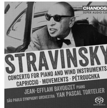
Stravinsky Works for Piano and Orchestra CHSA 5147