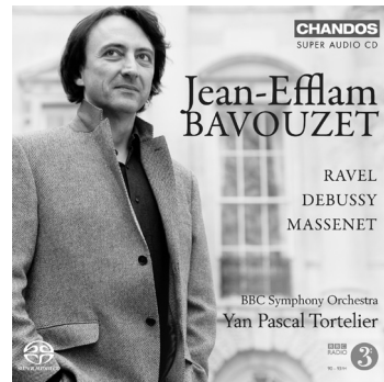
Ravel • Debussy • Massenet Piano Concertos etc. CHSA 5084