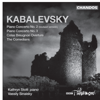
Kabalevsky Piano Concertos Nos 2 & 3 Colas Breugnon Overture • The Comedians CHAN 10052