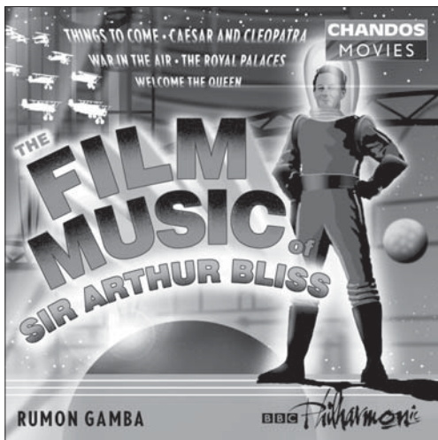
The Film Music of Sir Arthur Bliss CHAN 9896