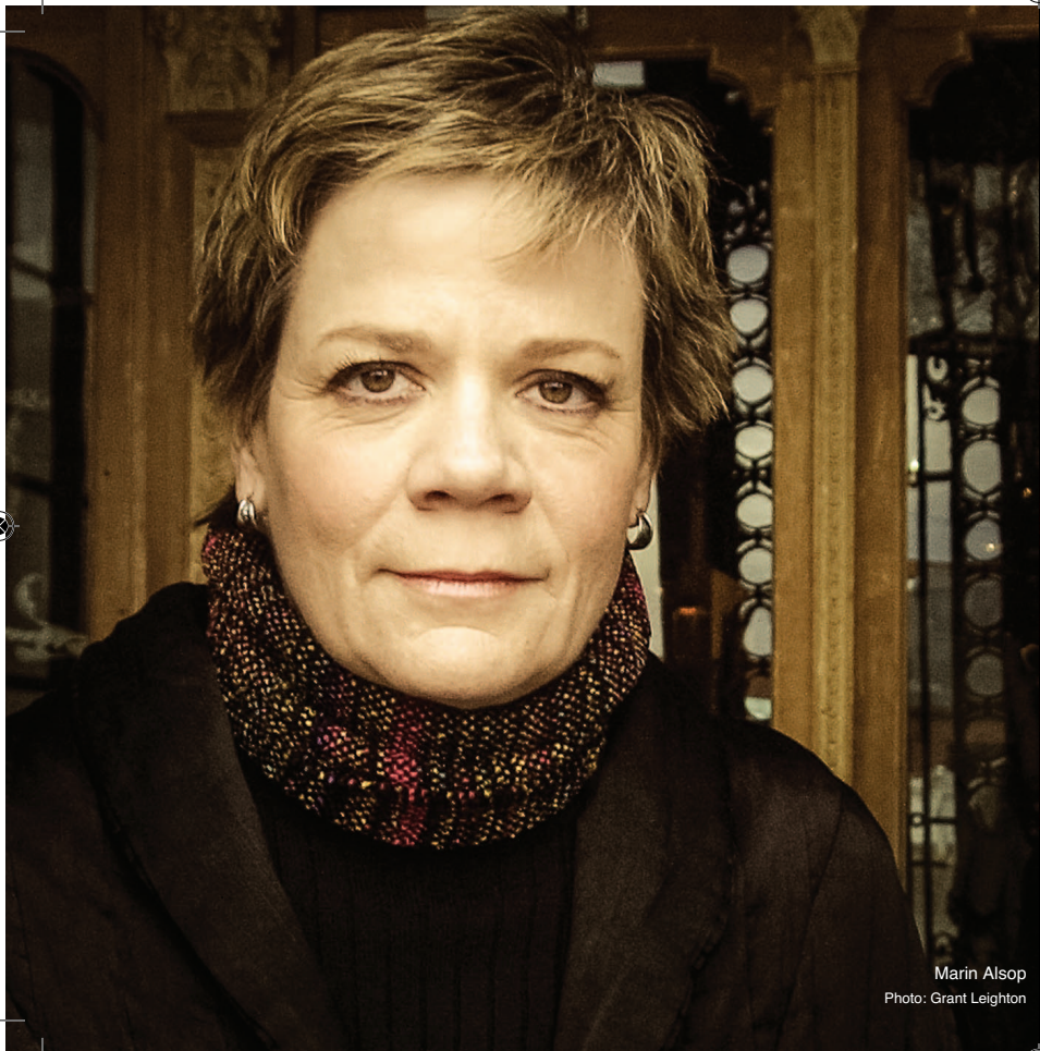
Marin Alsop