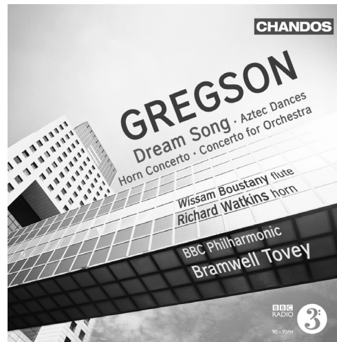
Gregson Dream Song • Aztec Dances • Horn Concerto • Concerto for Orchestra CHAN 10822