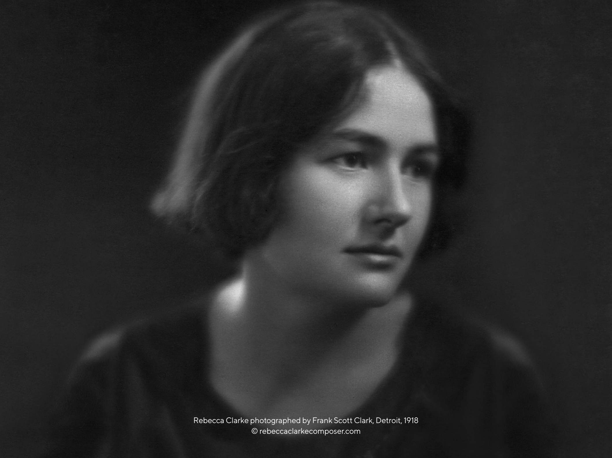
Rebecca Clarke