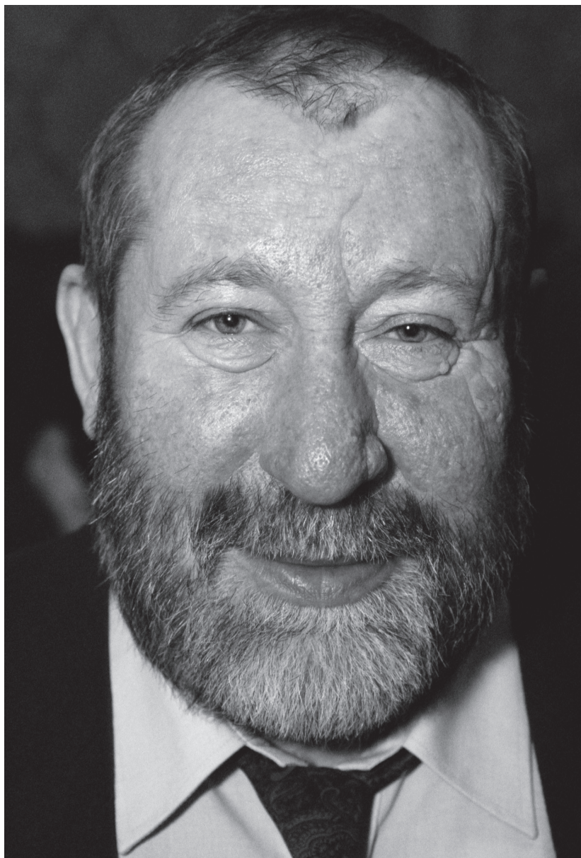
LUBOŠ FIŠER