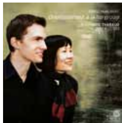
FRANZ SCHUBERT Divertissement à la hongroise op.54 Fantaisie en fa mineur op.103 Variations sur un thème original op.35 avec Zhu Xiao-Mei HMC 901754