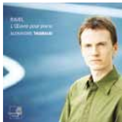
MAURICE RAVEL Intégrale de l'œuvre pour piano 2 CD HMC 901811.12