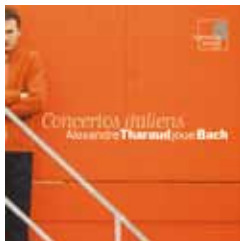
JOHANN SEBASTIAN BACH Concerto italien BWV 971 Concertos BWV 973, 975 (d'après Vivaldi) 974, 978 (d'après Marcello) HMC 901871

His harmonia mundi recording of the complete piano works of Ravel won worldwide critical approval (Diapason d'Or of the year 2003, Choc du Monde de la Musique , Grand Prix de l'Académie Charles-Cros, Stern des Monats in FonoForum , '10' rating in the Dutch magazine Luister , and a nomination for an Edison Award in 2004), as has his most recent Bach recording (Choc du Monde de la Musique for the year 2005, e in the Spanish monthly Scherzo , among other distinctions).