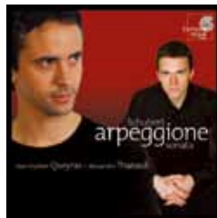
FRANZ SCHUBERT Sonate "Arpeggione" D.821 Sonatine, Berceuse, etc. + BERG : 4 Pièces op.5 + WEBERN : 3 Petites Pièces op.11 avec Jean-Guihen Queyras HMC 901930