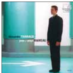
JEAN-PHILIPPE RAMEAU "Nouvelles Suites" Suites en la, en sol CLAUDE DEBUSSY Hommage à Rameau HMC 901754

Son intégrale de l'œuvre pour piano de Ravel (harmonia mundi) remporta tous les suffrages (Diapason d'Or de l'année 2003, Choc du Monde de la Musique , Grand Prix de l'Académie Charles-Cros, Stern des Monats de FonoForum , 10 de la revue néerlandaise Luister et une nomination aux Edison Awards 2004) comme son dernier enregistrement consacré à Bach (Choc de l'année 2005, e du mensuel espagnol Scherzo... ).