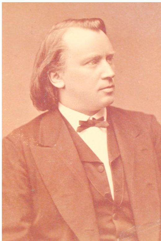
Johannes Brahms in 1876