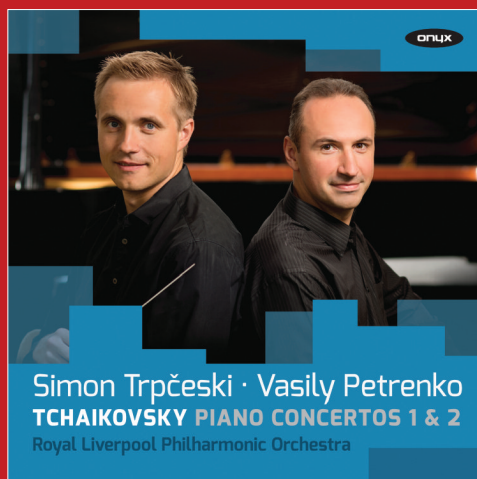
ONYX 4135 Tchaikovsky: Piano Concertos Nos. 1 & 2 Simon Trpčeski Royal Liverpool Philharmonic Orchestra Vasily Petrenko