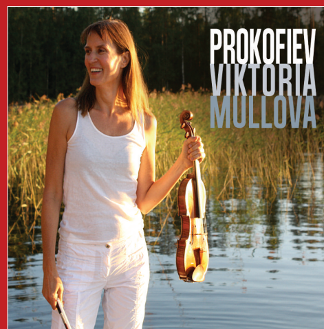
ONYX 4142 Prokofiev: Violin Concerto No.2, Sonata for Solo Violin, Sonata for two violins* Viktoria Mullova, Tedi Papavrami* Frankfurt Radio Symphony Orchestra Paavo Järvi