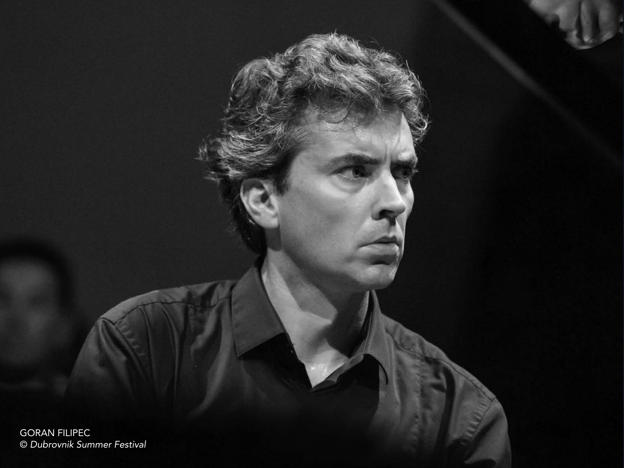
GORAN FILIPEC © Dubrovnik Summer Festival