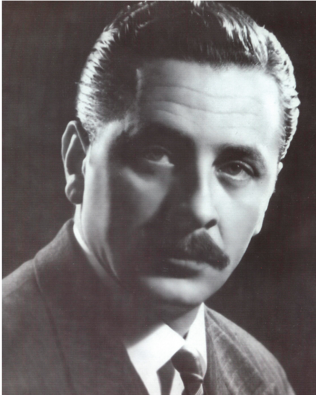
JOSÉ ANTONIO BOTTIROLI