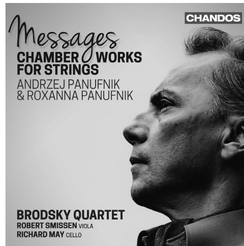
Andrzej and Roxanna Panufnik Chamber Works for Strings CHAN 10839