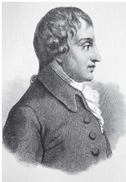
Giovanni Battista Pergolesi

Igor Strawinsky ist später auf die zwischenzeitliche Pergolesi-Begeisterung hereingefallen, stammen doch die