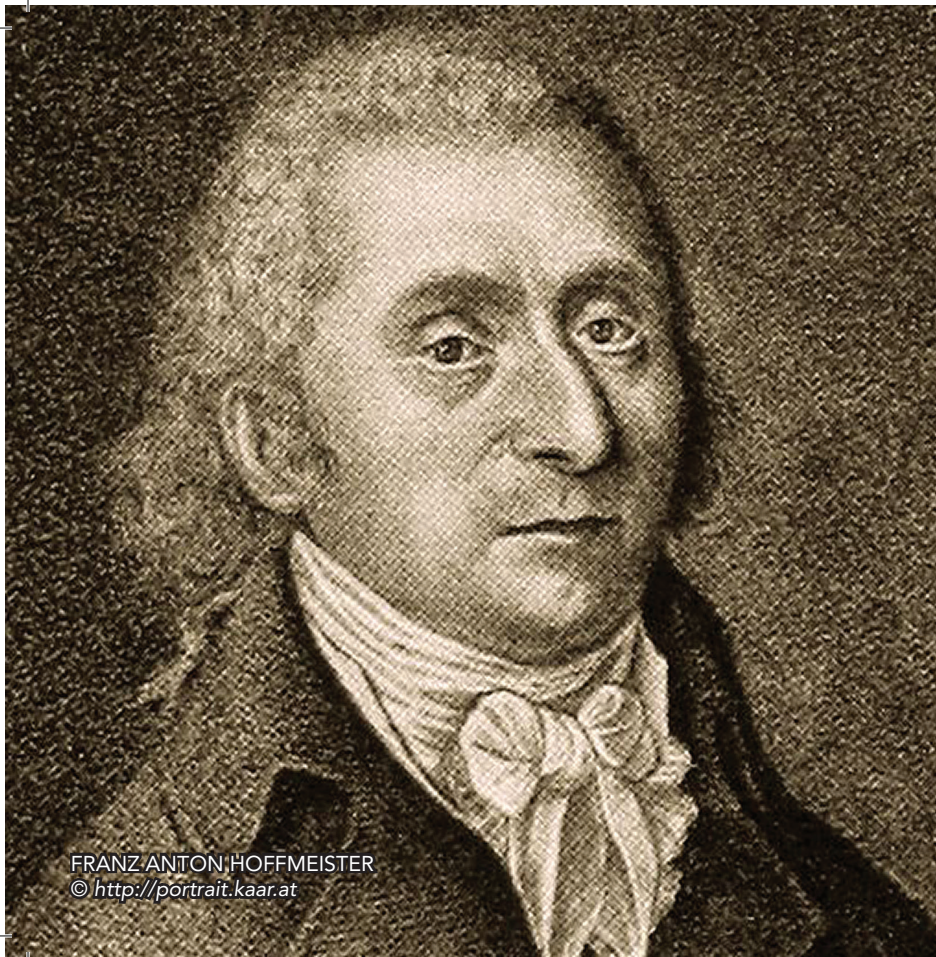
FRANZ ANTON HOFFMEISTER