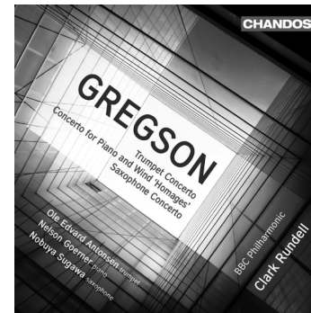
Gregson Trumpet Concerto Concerto for Piano and Wind 'Homages' Saxophone Concerto CHAN 10478