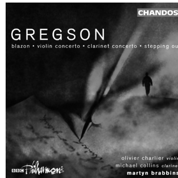
Gregson Blazon • Violin Concerto Clarinet Concerto • Stepping Out CHAN 10105