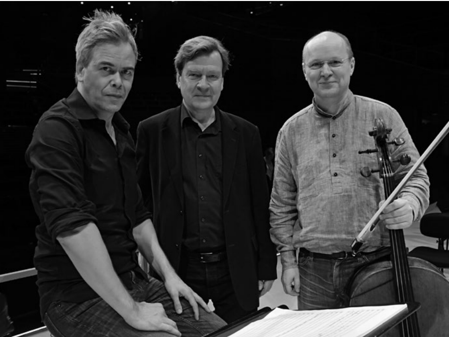
HANNU LINTU, MAGNUS LINDBERG and ANSSI KARTTUNEN