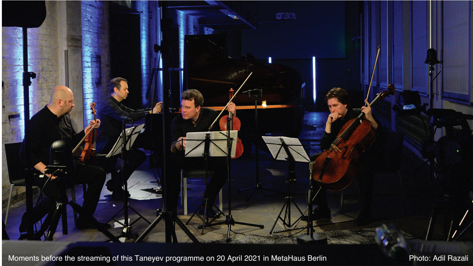
Moments before the streaming of this Taneyev programme on 20 April 2021 in MetaHaus Berlin